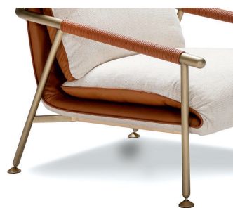
Struttura in metallo // Metal structure