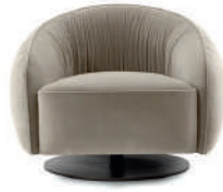
frontale // front