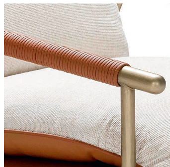
Bordino in ecopelle // Eco-leather piping